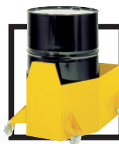
Bac de rétention (200 L)