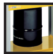
Kit support tonnelet