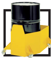
Bac de rétention (200 L)