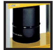
Kit support tonnelet