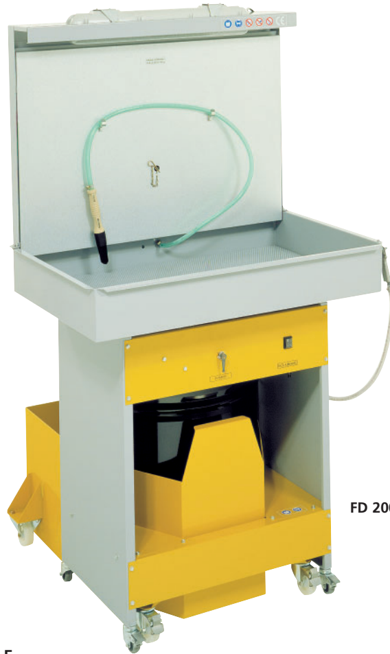
FD 200 Industry

Poste de dégraissage idéal pour la maintenance industrielle