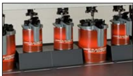
Réhausse pour boîtes de 1 Litre