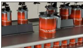
Plan de travail