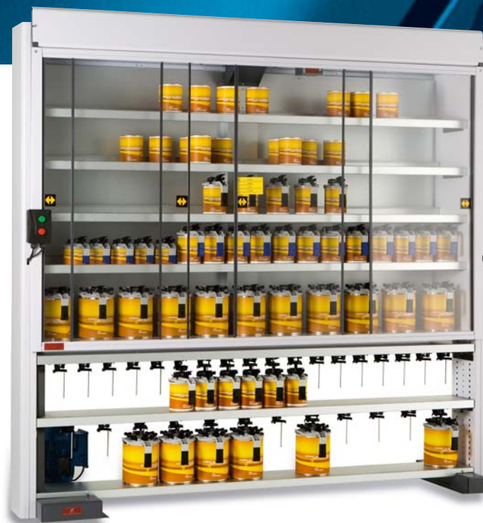
Fleximix 220 équipé de la Polarbox