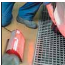
Pour les zones d'accès difficiles