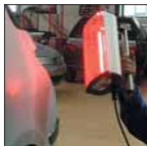
Séchage des petites surfaces