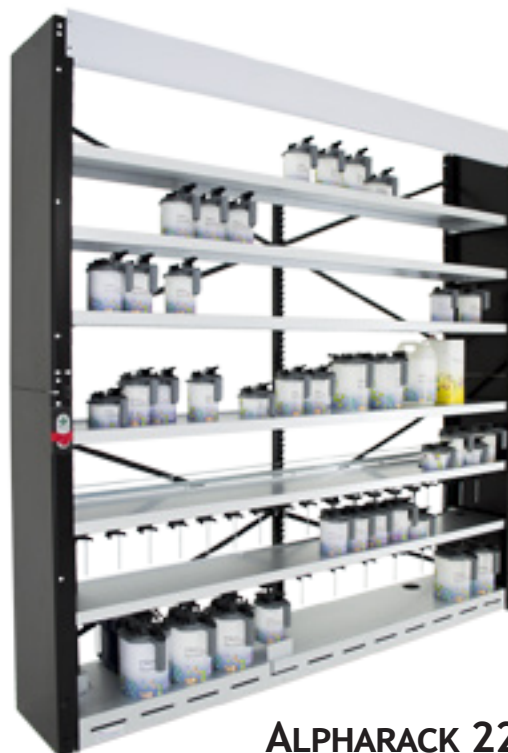
ALPHARACK 220 (EXEMPLE: STOCKAGE + AGITATION)