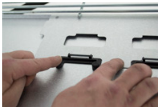
KIT DE POSITIONNEMENT