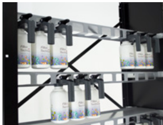
PEIGNES POUR SUSPENDRE VOS TEINTES (BOUTEILLES)